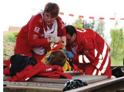
Rot Kreuz News