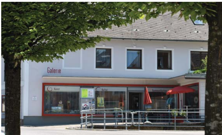
Galerie am Färberbach