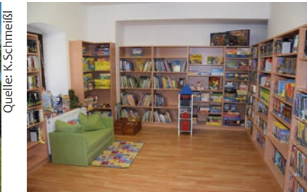
Bücherei - für jeden was dabei